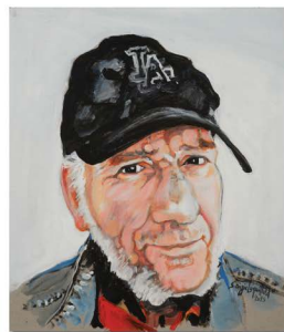
Une sœur peintre