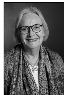
Un frère photographe

Portraits de gens qui vivent et/ou font vivre le Portrieux