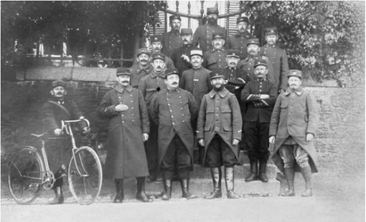
Le grand portail métallique est facilement reconnaissable.