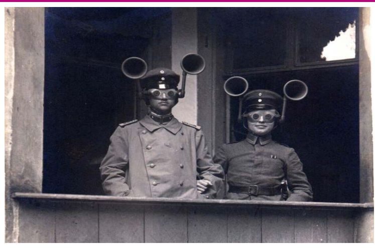
Deux membres d'une association concurrente espionnent l'Assemblée Générale dans l'espoir de nous voler de bonnes idées. 1954