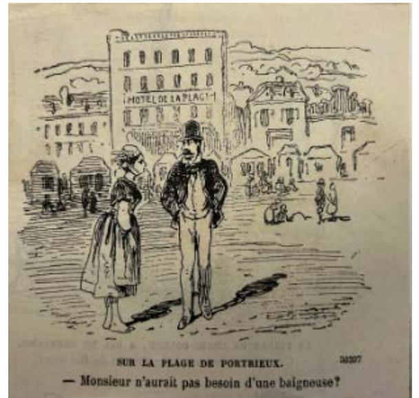
Dessin humoristique non daté. Interprétation libre...