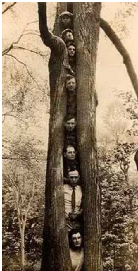
Ingénieuse proposition du Comité face à la crise du logement de 1936.