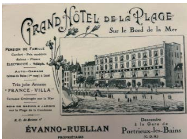
Carte publicitaire datée d'août 1926

Notons qu'à l'époque tous ces hôtels étaient réservés à une clientèle aisée. Le salaire journalier d'un ouvrier maçon était alors de 2 francs.