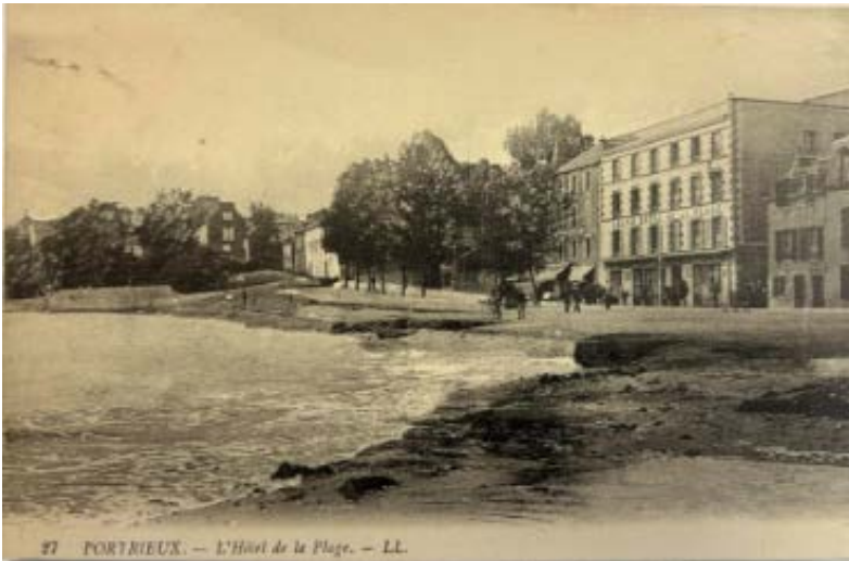
Carte postale écrite et oblitérée en juillet 1917.