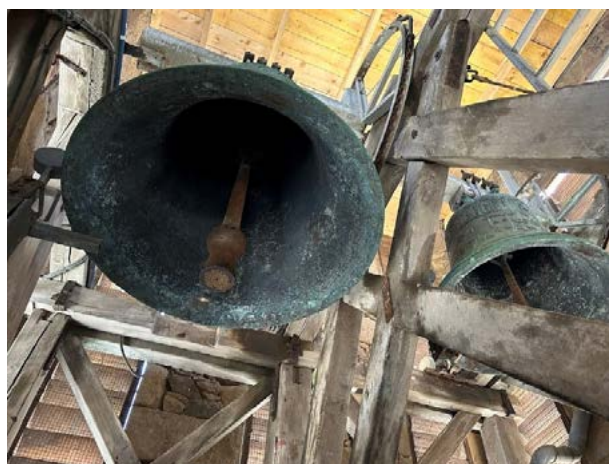
Les cloches sur leurs balanciers.