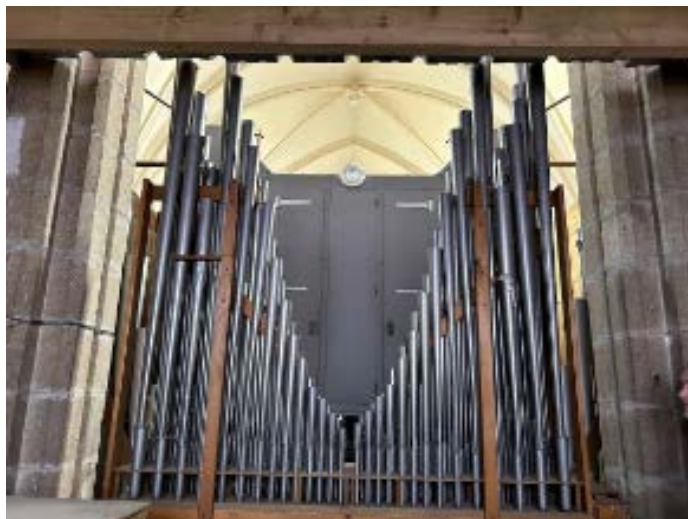
L'arrière du grand orgue.