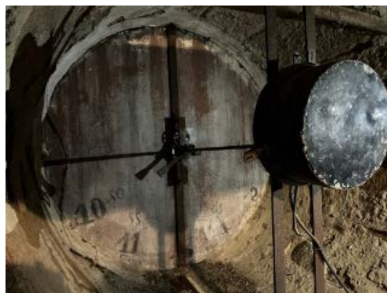
Le système de l'horloge.