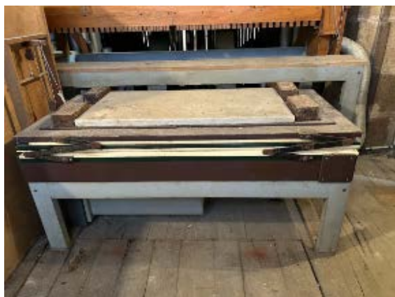
Le soufflet du grand orgue qui l'alimente en air.