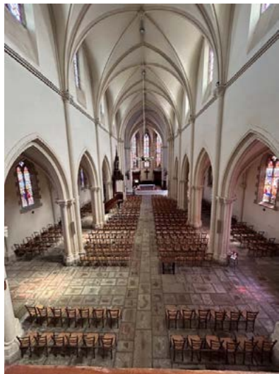
Vue du balcon du grand orgue.