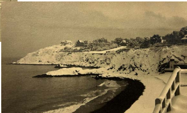
La plage du Châtelet et la pointe du Sémaphore. Hiver 1946.