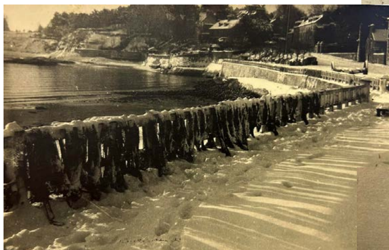
Le quai Robert Richet n'existe pas encore. 1946.