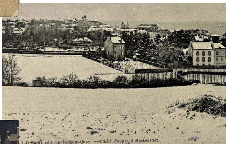
Carte postale oblitérée en 1916