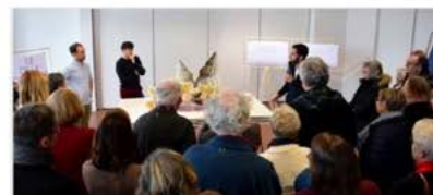
25 Mars 2020 Comtesse : écrire une nouvelle histoire Written by Service Com. Posted in Nature, Patrimoine En novembre dernier, le cabinet "Les Coccoillthes" était missionné par la Ville pour "penser le devenir" de l'île de la Lire la suite

Texte Daniel Tarin / Illustrations Soizic Loquillard