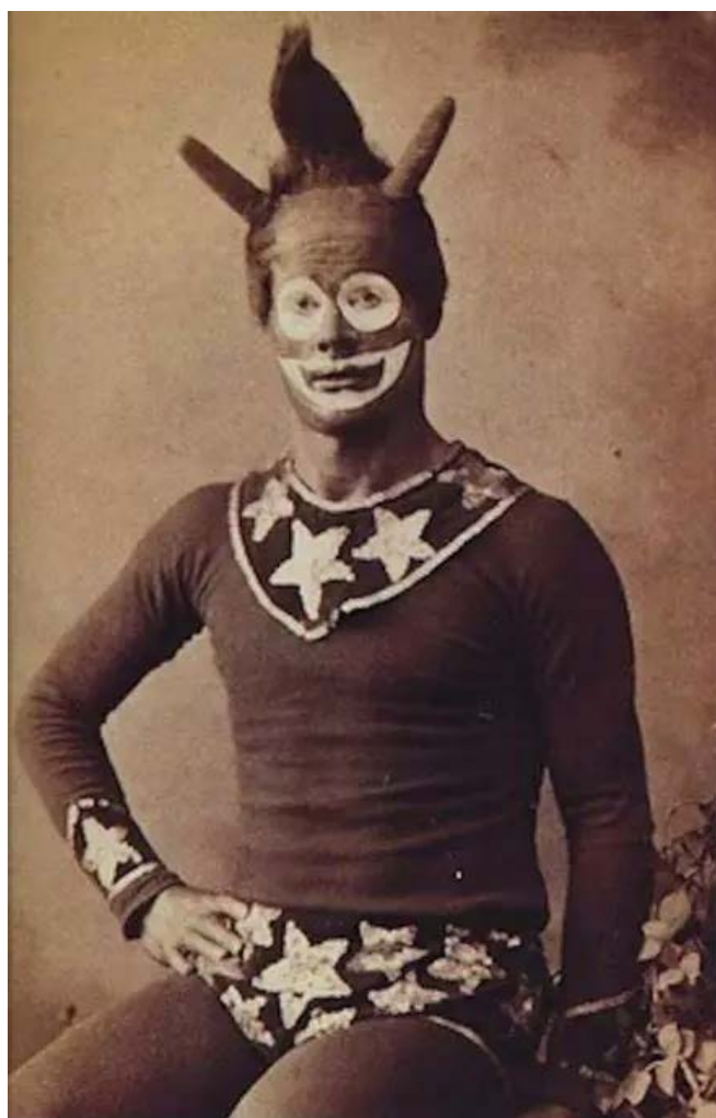
La samain, ça ne réussit pas à tout le monde.