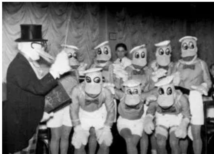
Réunion des anciens du Club des Cannetons.