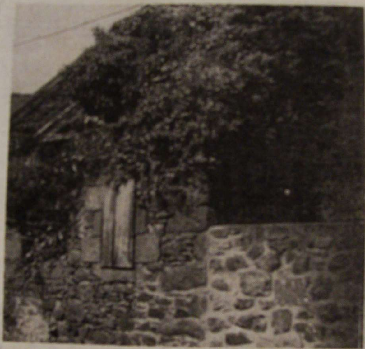
ST-QUAY-PORTRIEUX. — La première mairie de Portrieux, vieille de près de deux siècles et, faute de soins, menacée de disparaître... et ce serait dommage !