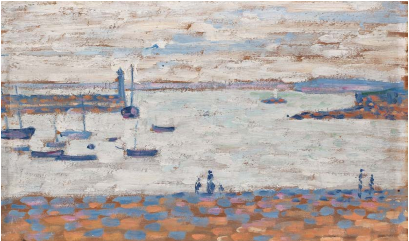
Entrée de port, Portrieux Signac Fitzwilliam Museum ...

L'amour du peintre Paul Signac pour la voile et la mer transparait dans cette vue de la cité balnéaire de Portrieux en Bretagne, l'un de ses lieux de prédilection. Signac utilise des coups de pinceau audacieux et une palette minimale pour représenter le mouvement et les textures du ciel, de la mer et du sable.