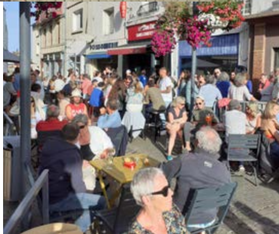
Lableue Guitare le 20 Août