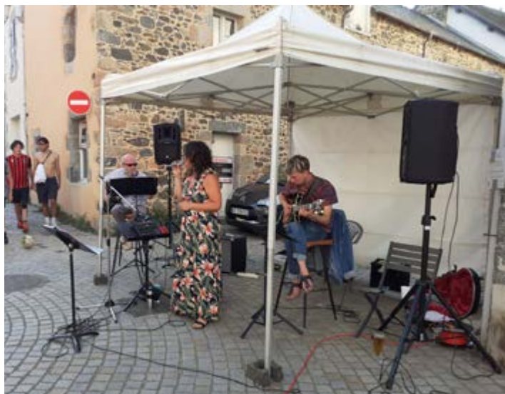
L'inconnue d'à côté le 23 Juillet