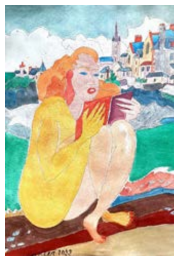
Peinture de H. Landier pour l'affiche.