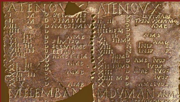
Calendrier celtique, dit «de Coligny» découvert dans l'Ain.

M LA : Cela se dit parce que l'on trouve beaucoup de traces, de textes, sur la Samain en Irlande. Mais on a aussi trouvé dans l'Ain un calendrier gaulois, dit «calendrier de Coligny», qui fait mention de Samionos, Samain en gaulois. Samionos étant à la fois le mois de décembre et la fête de passage. Cependant ce sont les irlandais qui ont perpétué la tradition, notamment aux Etats-Unis, qui deviendra Halloween. Elle a perdu en chemin toute la symbolique des celtes.